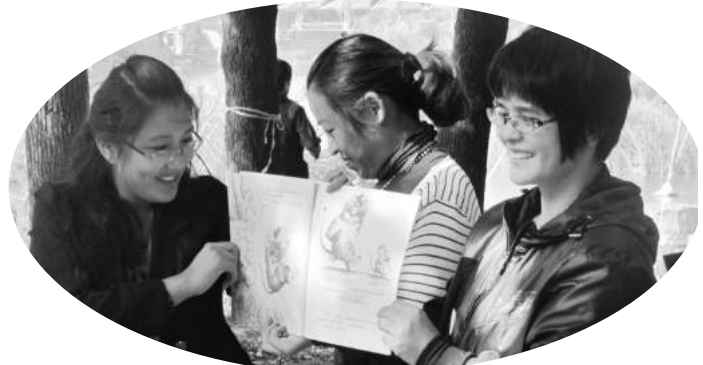
小书房组织户外阅读活动

我是一个爱做梦的男孩,不活在当下,我要提高自己的专业技能,为未来练就扎实的基本功。在学习中,我注重书本知识与实操技能的平衡,因为毕业时我们要一个面对工作与生活中的种种困难。我认为,认真上课,做好课堂笔记,和老师课